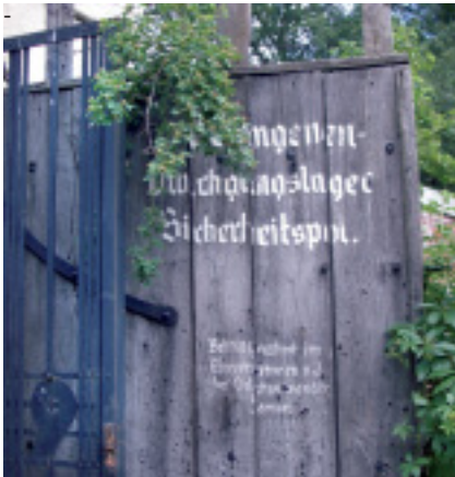
Eingangstor zum Gestapo-Gefängnis Rotunde

der, die später zu ihren Eltern zurückgekehrt sind. Gemäß den Angaben der Stiftung „Polnisch-Deutsche Aussöhnung“ leben in Zamosc und in der näheren Umgebung über 5.000 NS-Verfolgte aller Verfolgungskategorien, die Anträge auf Leistungen aus den Mitteln der Stiftung „Erinnerung, Verantwortung und Zukunft“ gestellt haben. Sehr viele dieser älteren Menschen befinden sich heutzutage in einer schwierigen materiellen und gesundheitlichen Lage.