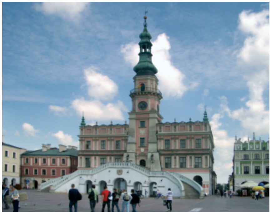
Blick auf das historische Rathaus von Zamosc

Der Bundesverband Information & Beratung für NS-Verfolgte e.V. und das Stowarzyszenie Zamojskie Centrum Wolontariatu richten eine Beratungsstelle in Zamosc ein